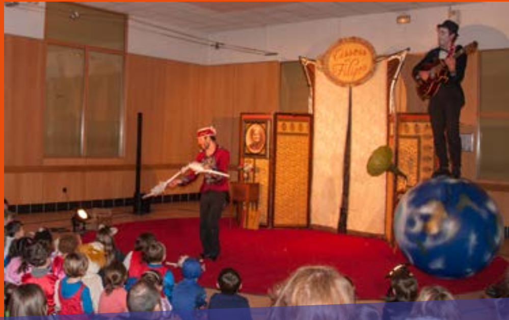
Le 17 février, au sein de la salle Municipale Jean Jaurès, le CarnaBal bat son plein, en musique, en magie et en spectacle.