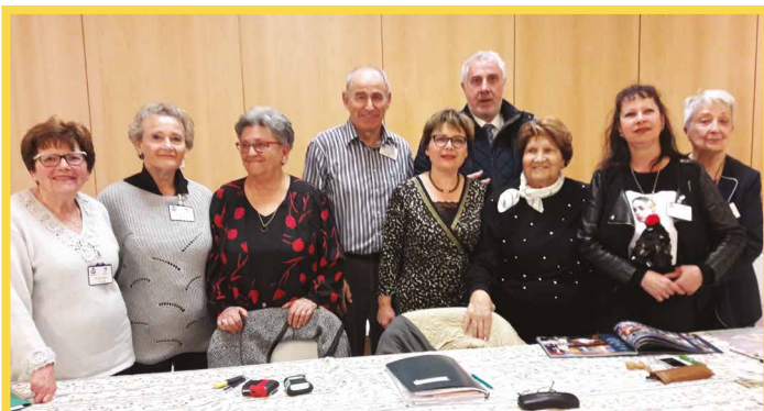
L'association des jumelages se réunit le 15 mars à l'occasion de leur Assemblée Générale