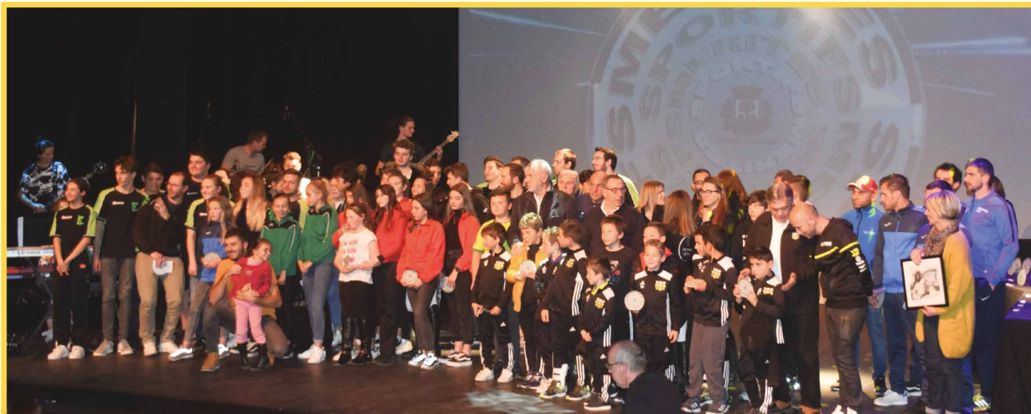
Vendredi 1 er mars, la municipalité organise la cérémonie des mérites sportifs au théâtre Jean-Marie Sévolker. Cet évènement permet de mettre en avant la diversité et les excellents résultats du monde sportif gémenosien