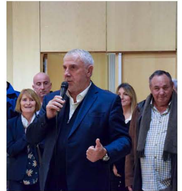
Le 15 novembre, la cérémonie des nouveaux arrivants réunissait une centaine de personnes au sein de la salle municipale Jean Jaurès. L'occasion pour Monsieur le Maire d'accueillir de façon conviviale ces nouveaux Gémenosiens et leur brosser le portrait de leur commune de résidence.