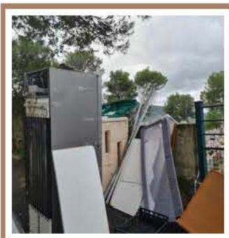
Dépôt sauvage constaté aux abords du cimetière à l'occasion de la période de la Toussaint.

Concernant les ordures ménagères, nous vous rappelons qu'il ne faut pas déposer vos ordures avant 18h le soir, le ramassage s'effectue tôt le matin dans le centre du village.