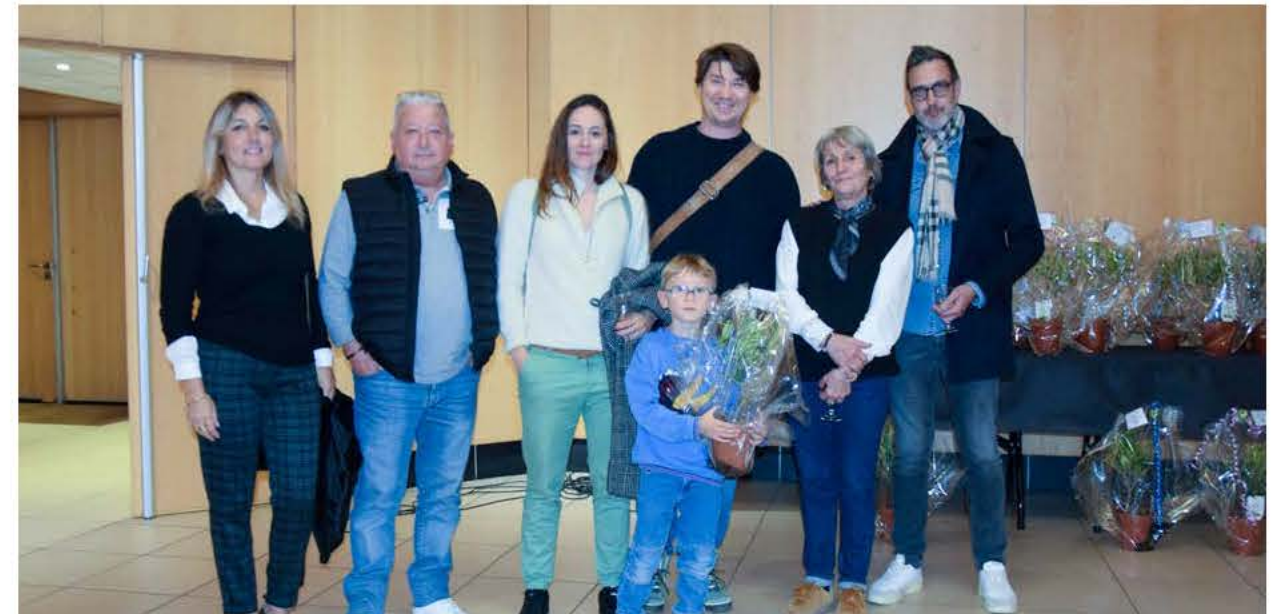
À l'occasion de l'instant de partage, chaque famille est repartie avec un olivier en guise de cadeau de bienvenue.