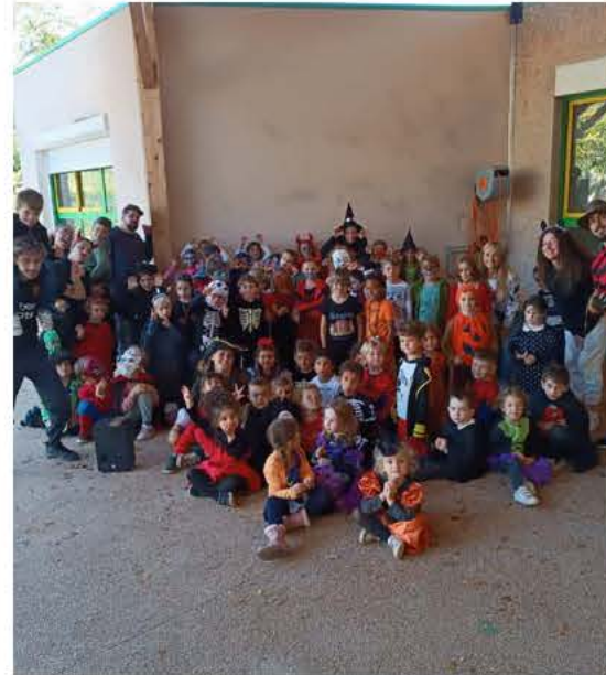
Ces vacances de Toussaint coïncidaient avec l'événement Halloween et les enfants du centre aéré s'étaient grimés et transformés en petits monstres afin de se présenter sous les fenêtres de Monsieur le Maire où ils ont obtenu des friandises.