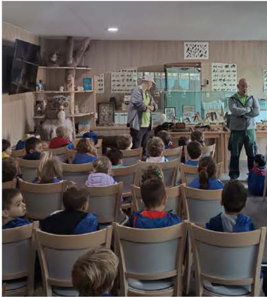
Durant les vacances de la Toussaint, les enfants du centre aéré se sont rendus à Cuges-les-Pins où ils ont pu découvrir « Les Aigles de la Sainte Baume ». Cette visite de la fauconnerie leur a fait découvrir sous un aspect ludique le monde des rapaces de manière pédagogique.