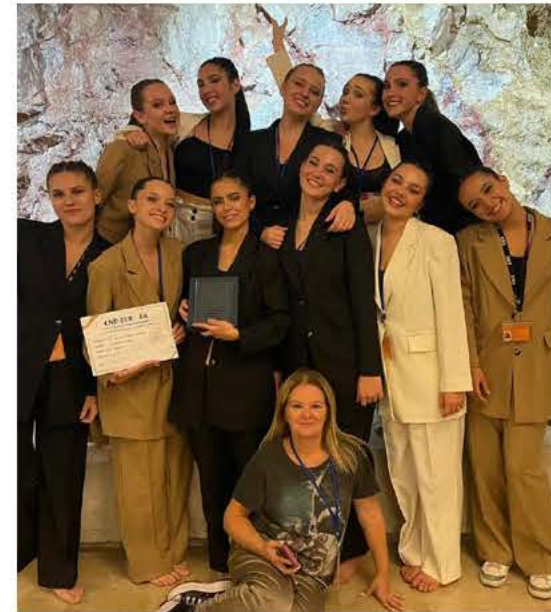
L'EDELWEISS DANSE à Gémenos a obtenu lors du concours de danse européen à Tarragone, vendredi 3 novembre, le titre de vice-championne d'Europe dans la catégorie 16-24 ans en Modern Jazz pour la chorégraphie «LA HORDE».